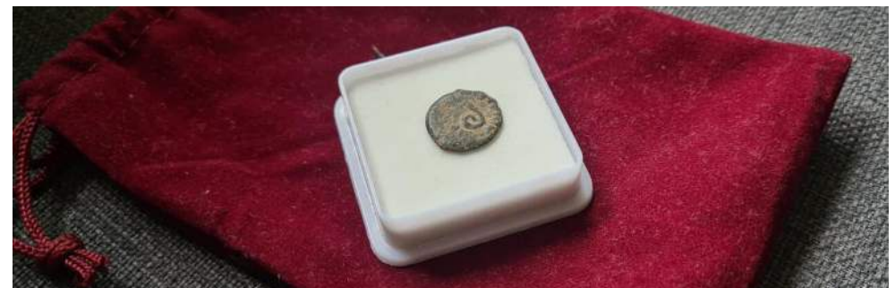
Pilatus-Münze, 26-36 n. Chr.

Viele haben sich schon gefragt, was eigentlich Pontius Pilatus , ein nicht sehr bedeutender römischer Funktionär, im wohl bedeutendsten christlichen Glaubensbekenntnis, dem bereits erwähnten Apostolischen Glaubensbekenntnis, verloren hat. Wer so fragt hält diese Namensnennung vielleicht für eine unnötige und überflüssige Nebensächlichkeit. Viele würde lieber andere Dinge noch Einbauen in dieses Bekenntnis, welche sie vermissen: ein paar christliche Werte zum Beispiel. Doch anstatt Bekenntnisse zu revidieren, sollten wir uns besser fragen, warum sie so sind, wie sie sind!