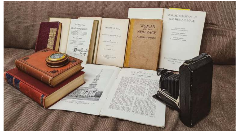
Evolutionslehre, Malthusianismus und Eugenik als progressive Megatrends und Quelle der Inspiration für Forscher, Feministen, Sexologen, Theologen...

Aus der Evolutionslehre von Darwin und genährt von malthusianistischen Ängsten entwickelten sich im späten 19. Jahrhundert auch Ideen, wie das Wachstum der Bevölkerung nicht nur zahlenmäßig durch Geburtenkontrolle gelenkt werden könnte, sondern auch aktiv in Richtung einer ‚gesunden‘ und für die Gesellschaft ‚produktiven‘ Bevölkerung gefördert werden könnte: die Geburtsstunde von Eugenik und Rassenhygiene . Der Wert des menschlichen Lebens wurde abhängig gemacht vom potentiellen Nutzen respektive dem potentiellen Schaden für die Gesellschaft. Im populären Verständnis sind Eugenik und Rassenhygiene Eigenheiten des deutschen Nationalsozialismus. Doch müssen wir zur Kenntnis nehmen, dass diese Ideen in den ersten Jahrzehnten des 20. Jahrhunderts sozusagen das progressive Steckenpferd einer westlichen kulturellen und wissenschaftlichen Elite waren - der ‚Lackmusktest‘, ob man zu den Fortschrittlichen oder den Rückständigen gehörte. [16]