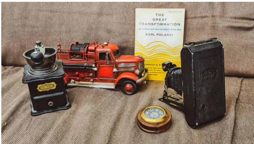
Karl Polanyi dokumentierte 1944 den tiefgreifenden Wandel der westlichen Gesellschaften durch die Industrialisierung.

waren, wurden im Einflussbereich der Industrialisierung tendenziell zu funktionslosen Übernachtungsplätzen.