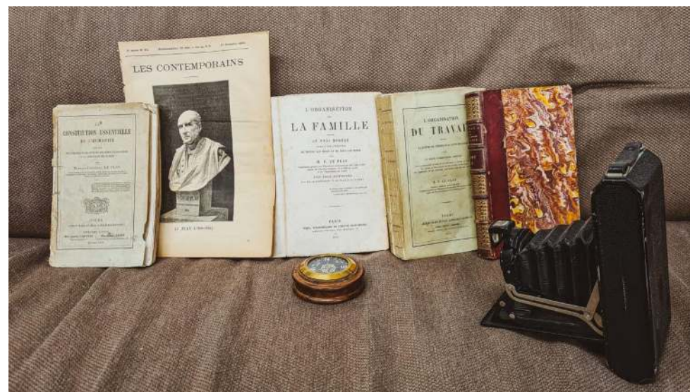
Frédéric Le Play, der grosse Sozialreformer und Staatsrat von Napoleon III, findet durch seine Forschungen vom Atheismus zum Christentum.

Was der Atheist und Skeptiker Le Play im Rahmen seiner ausgedehnten Forschungsreisen feststellte, stand im Gegensatz zu den damals trendigen Theorien seiner liberalen und sozialistischen Zeitgenossen: Er stellte einen unmittelbaren Zusammenhang fest zwischen dem, was er ‚Stammfamilie‘ nannte und historischen Beispielen von stabilen, kreativen Kulturen. Für Le Play wurde klar: nicht das Individuum sollte als Grundzelle der Gesellschaft gesehen werden, sondern die 3 Generationen umfassende Stammfamilie. Diese, so seine Argumentation, kombinierte gleichzeitig einen Gemeinschaftssinn und die Möglichkeit für individuellen Ausdruck. Die Stammfamilie vermied einerseits den einengenden Charakter einer rigiden patriarchalen Familie und andererseits auch den egoistischen und atomisierenden Charakter der modernen liberalen Systeme. Die Familie war bei Le Play das "wahrhafte soziale Molekül" ( véritable molécule sociale )[24] und die Quelle für Stabilität, Fortschritt und authentische Freiheit.