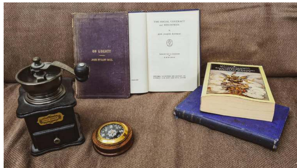
Figuren wie Rousseau, Godwin oder Mill beeinflussten massgebend den Trend zum Individualismus und zu liberaleren Gesellschaftsformen.

Jean-Jaques Rousseau (1712-1778) sah im Staat so etwas wie den Ersatz für die Familie. [6] Ehe und Familie sah er eher als Hindernis für den Menschen, der sein ‚authentisches Selbst‘ leben wollte. Leitfiguren des Utilitarismus wie William Godwin (1756-1836) oder John Stuart Mill (1806-1873) sahen in der Familie tendenziell eine ‚Schule des Despotismus‘, als Institution, welche den natürlichen Instinkten des Menschen zuwiderlief, dem persönlichen Genuss im Wege stand. [7] In Godwins Sozial-Utopie war kein Mann exklusiv an eine Frau gebunden, sondern alle würden einander in einer grossen sexuellen Gemeinschaft teilen. [8] Die Stossrichtung war somit gegeben: Ehe und Familie standen der Freiheit und dem Glück des Individuums im Wege. Mit im Wege stand auch die Kirche, welche mit konservativer Sexualmoral die Institution Familie stützte und einer ‚befreiten‘ Sexualität im Wege stand. Auch erste Konzepte von ‚serieller Monogamie‘ verbunden mit vereinfachten Scheidungsmöglichkeiten entstanden. [9] Familienbände, seien es diejenigen zwischen den Ehegatten oder zwischen Eltern und Kind, wurden in dieser Zeit zunehmend im Sinne einer Machtausübung des einen Menschen über den anderen gesehen und nicht mehr als die natürliche Form menschlichen Zusammenlebens.