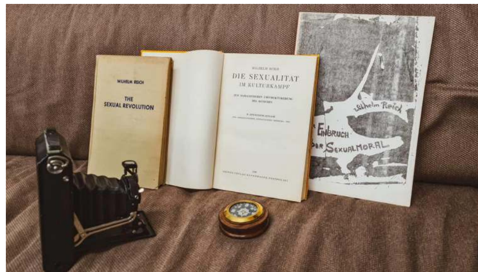
Wilhelm Reich und sein Einfluss: "Die Sexualität im Kulturkampf" (Mitte, 1936), die US-Ausgabe (Links, 1945), Raubkopie aus der Zeit der 68er Bewegung (Rechts)

dem Weltkrieg seine Bücher verboten worden. Reich wurde der Prozess gemacht und er verstarb 1957 im Gefängnis. Doch nun, in den 60er Jahren, wurden seine Bücher abgetippt, Raubkopien gedruckt und unter der Hand verkauft. Sie fanden reissenden Absatz. Die sexuelle Revolution der 68er Bewegung war da, und Wilhelm Reich war einer ihrer grossen Helden.