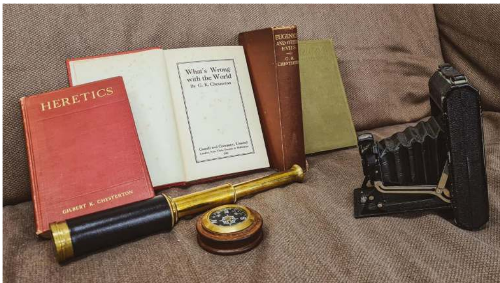
G.K. Chesterton. Vor 100 Jahren ein scharfer Analytiker des Zeitgeistes. Seine Schriften reden auch in unsere Zeit hinein.

Wie die Natur sich nach einem Sturm oft schnell wieder regeneriert, so bleibt die natürliche Familie auch im Jahr 2021 eine ‚resiliente Spezies‘. Ihr dürfen weit mehr Zukunftschancen zugeschrieben werden als den Ersatzkonzepten, die der Mensch über die vergangenen Jahrhunderte entwickelt und ausprobiert hat.