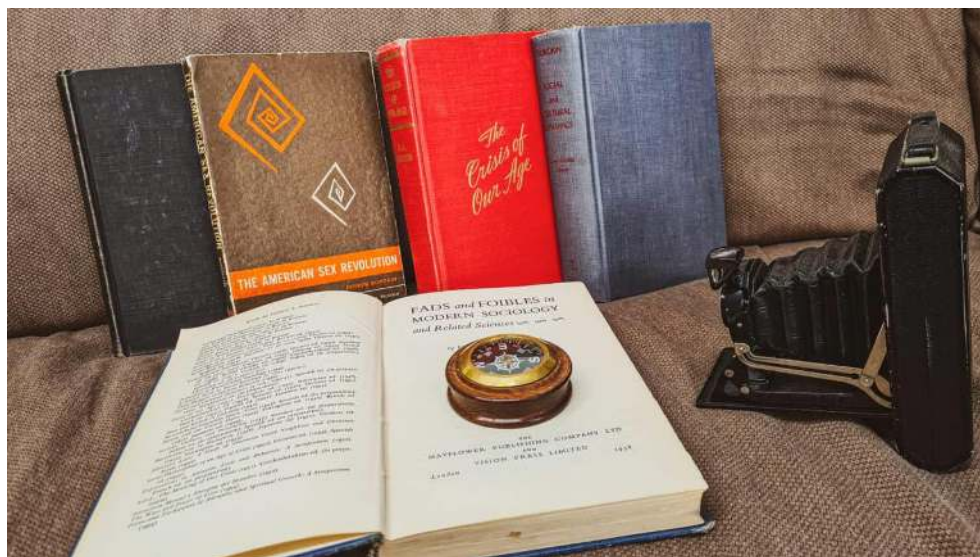
Pitirim Sorokin. Der russische Revolutionär, Dissident und Gründer der Soziologieabteilung von Harvard, prognostizierte in den 50er Jahren die sexuelle Revolution der 60er.

Eine zweite solche Persönlichkeit ist Pitirim Sorokin (1889-1968). Der Gründer der soziologischen Abteilung an der renommierten Harvard Universität und zeitweilige Präsident der Soziologischen Gesellschaft der USA identifizierte wie Le Play die Stammfamilie als die stabilste, natürliche soziale Form. [25] Sorokin stellte in seinen umfangreichen Forschungsarbeiten [26] eine Verbindung zwischen schrumpfenden Familiengrößen und sozialen Unruhen fest und betonte die Wichtigkeit von Bildung als familiärem Kernauftrag.